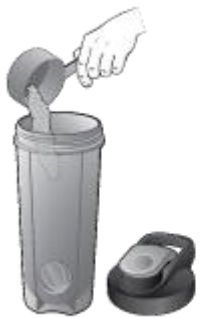
Pour in the powder