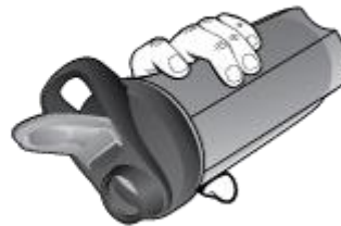
Ready to drink